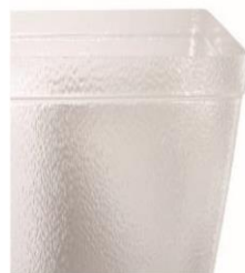
PMMA Wanne strukturiert